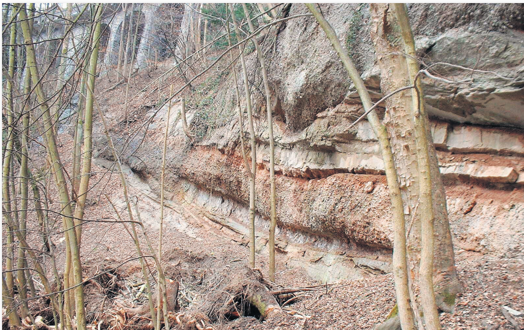
Für das Erdwärme-Projekt der Stadt St. Gallen sollen wasserführende Gesteine des tiefen Untergrundes genutzt werden. Diese Gesteinsschichten sind im ganzen Gebiet des zentraleuropäischen Alpenvorlandes verbreitet und können auch an der Oberfläche beobachtet werden.

Redaktion: Fachstelle Kommunikation, Amt für Umwelt und Energie infoerdwaerme@stadt.sg.ch, www.erdwaerme.stadt.sg.ch