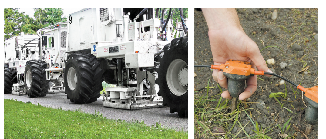
Die Vibrationsfahrzeuge sehen unheimlich aus, sind es aber nicht: Sie erzeugen die Schallwellen, die im Untergrund reflektiert werden.

Die seismischen Messungen machen den Untergrund von St.Gallen transparent. Sie geben Aufschluss über den Verlauf der wasserführenden Schichten in der Zieftiefe und bilden damit die Voraussetzung für die Evaluation des Standorts für das Erdwärme-Kraftwerk. Das Prinzip seismischer Messungen besteht darin, Schallwellen zu erzeugen und deren Echo von den verschiedenen Gesteinsschichten im Untergrund an der Erdoberfläche aufzufangen. Die Erzeugung der Schallwellen erfolgt durch